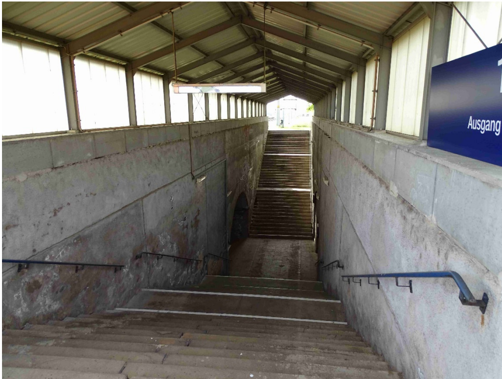
Bahnsteig 2, Blick in Treppenzugang