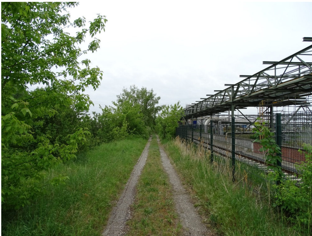
Zufahrt zum Bahnsteig 1