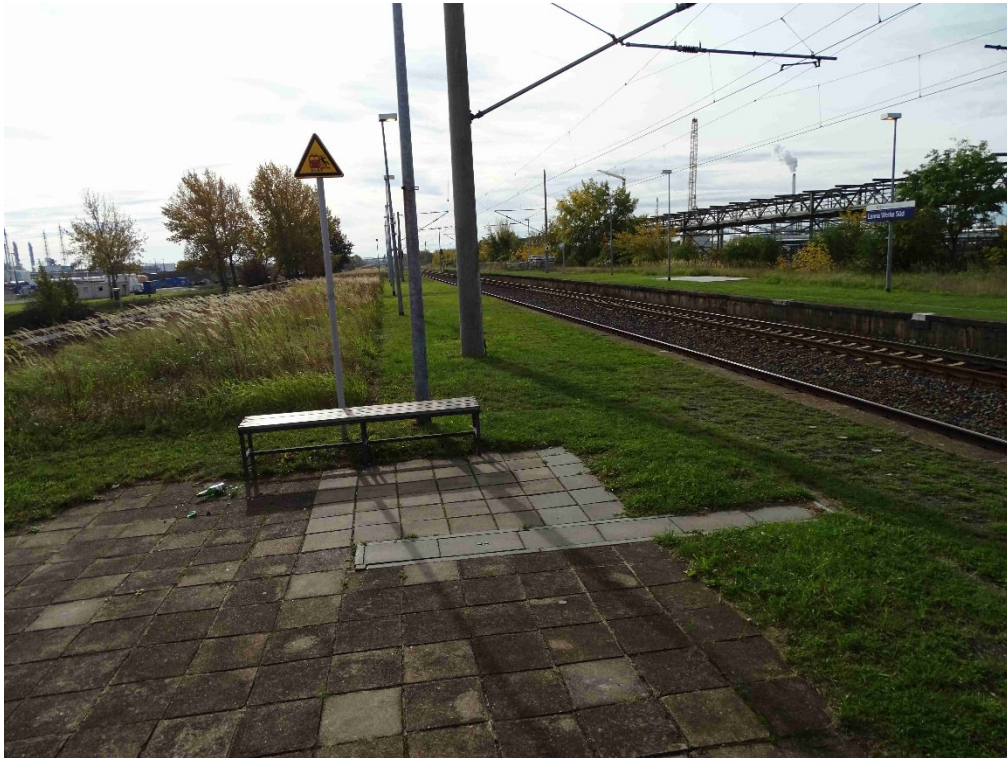
Bahnsteig 1 Wartebereich