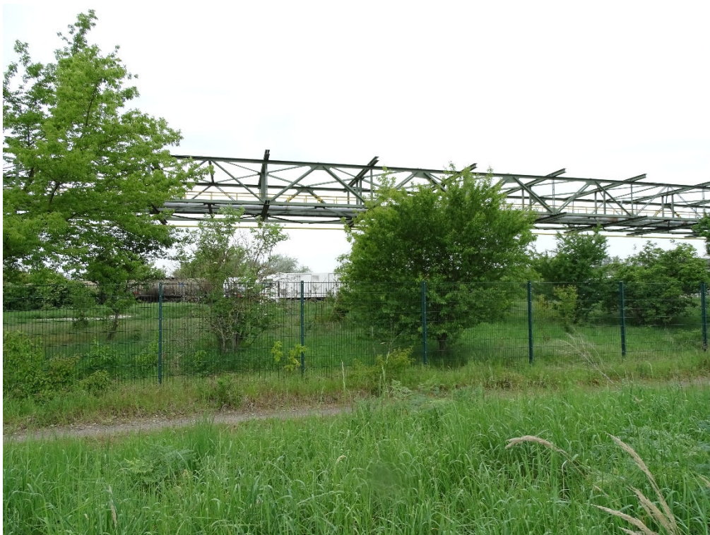
Zaunanlage zum Werksgelände der InfraLeuna GmbH Bereich Zufahrt Bahnsteig 1