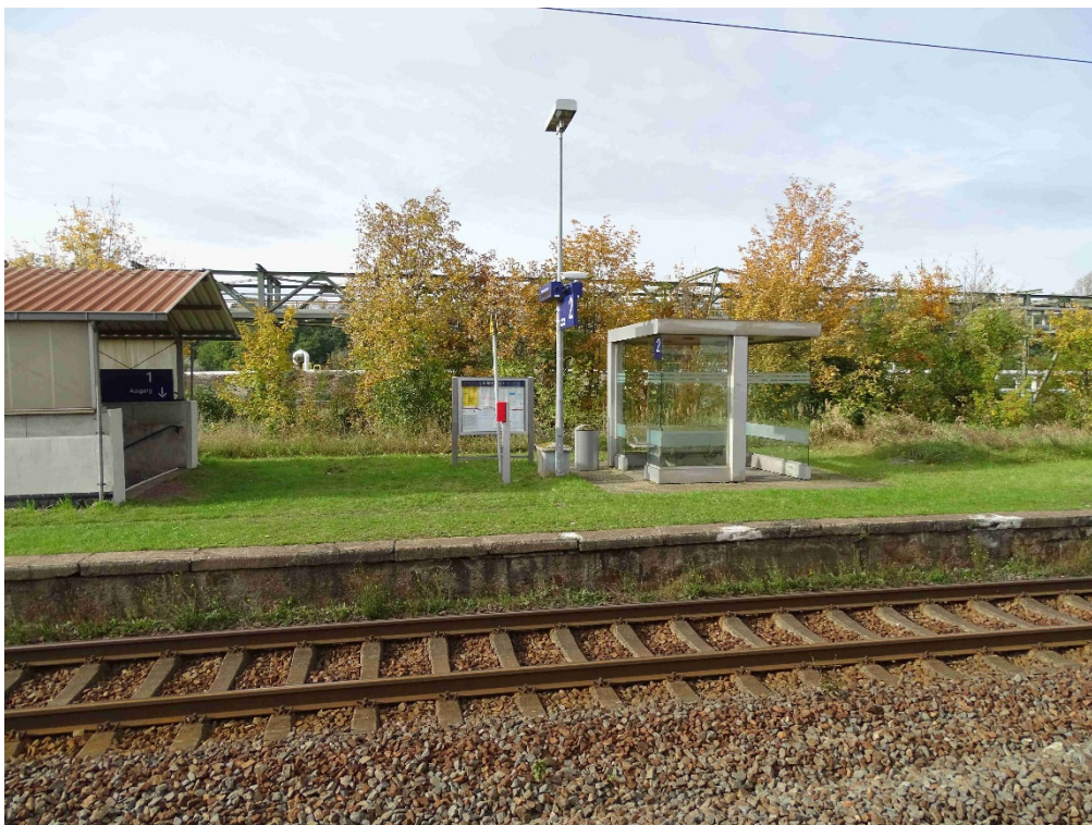
Bahnsteig 2, Wetterschutz und Treppenzugang