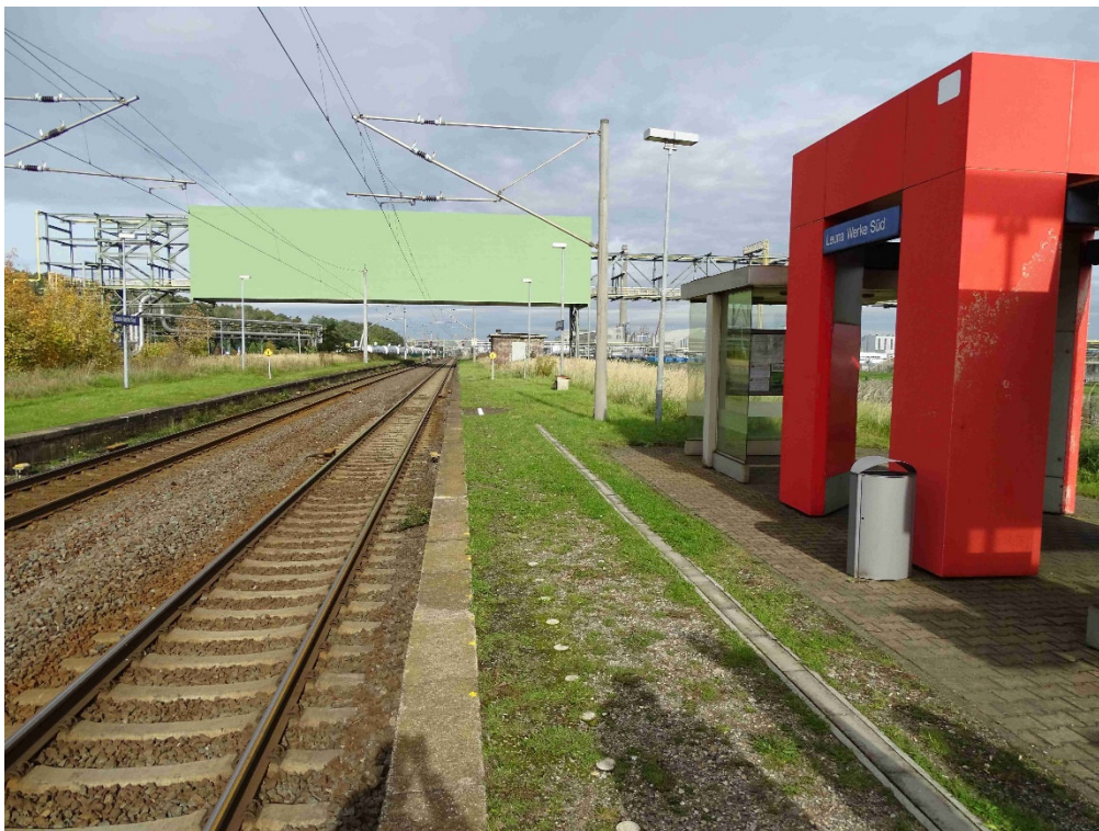
Bahnsteig 1 Wetterschutz