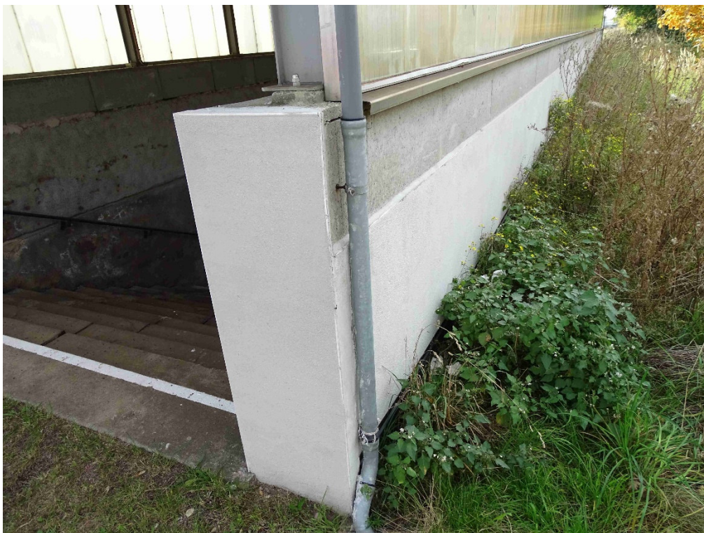
Treppeneinhausungen Bahnsteig 2 Sockelbereich außen