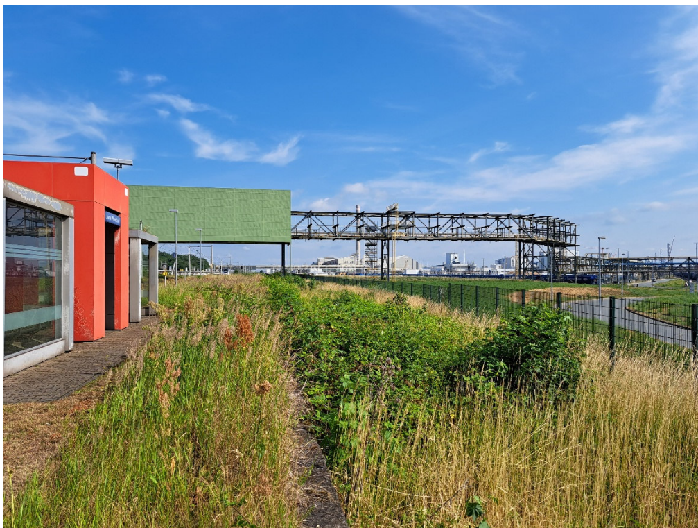
Rohrbrücke im Bereich BE-Fläche und Zufahrt Bahnsteig 1