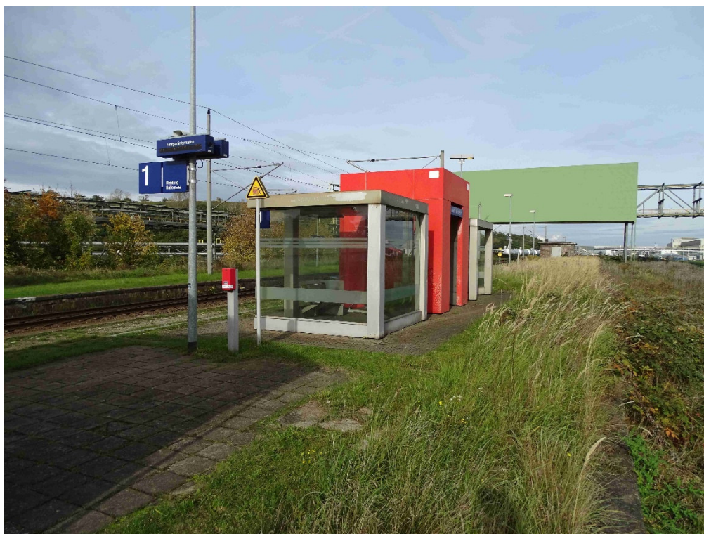
Bahnsteig 1 Wetterschutz, DSA am Beleuchtungsmast